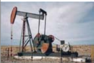
Aparatos Ind. Bombeo Mecánico