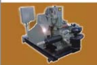
Generación de Energía

Volumen de bombeo ajustable a través de una palanca de velocidad que le permite ajustar la potencia de salida de forma rápida y fácil. Durabilidad y originalidad Diesel aplicadas a motor para pozos petrolíferos. La experiencia de Diadema en el desarrollo y fabricación de innovadores motores diesel ha sido plenamente aplicada a este motor de combustible de gas natural para mejorar la fuente de alimentación en pozos petrolíferos. Puede ajustarse la velocidad del motor entre 300 - 1100 rpm, con una potencia máxima de 32 HP.