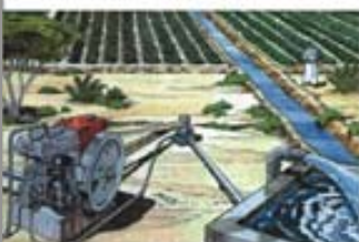
Extracción de Agua